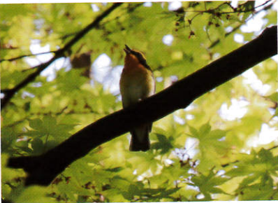
ねがいの小路での「キビタキ」

五頭山麓・村杉温泉エリアは 野鳥の宝庫です。時には上を 見ながら歩いてみませんか！