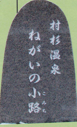
ねがいの小路入口