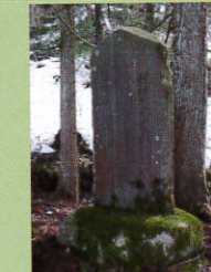
奥村杉キャンプ場